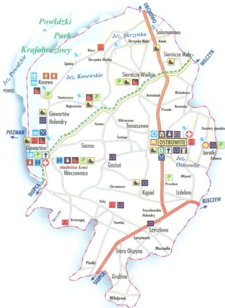
Rys. 1. Mapa Gminy Ostrowite

W latach 1975 – 1998 miejscowość administracyjnie należała do województwa wielkopolskiego.