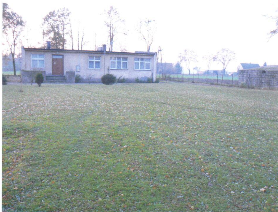
Zdjęcie 2. Budynek świetlicy wiejskiej w Izdebnie

Przez wieś przebiega ruchliwa droga wojewódzka nr 263. Znajduje się tam również przystanek PKS.