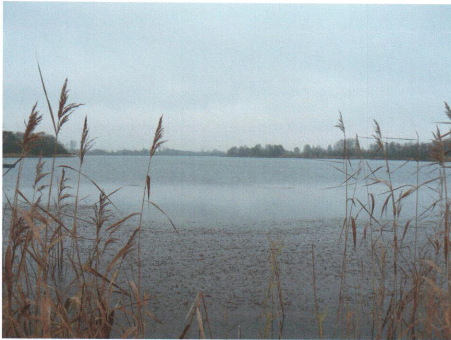
Zdjęcie 4. Jeziro Koziegłowskie

Od północnej strony wieś otoczona jest bagnami oraz Jeziorem Koziegłowskim.