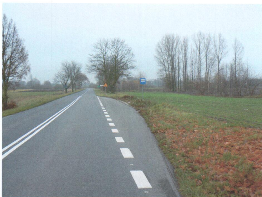
Zdjęcie 3. Przystanek PKS w Izdebnie

Przez wieś przebiega ruchliwa droga wojewódzka nr 263. Znajduje się tam również przystanek PKS.