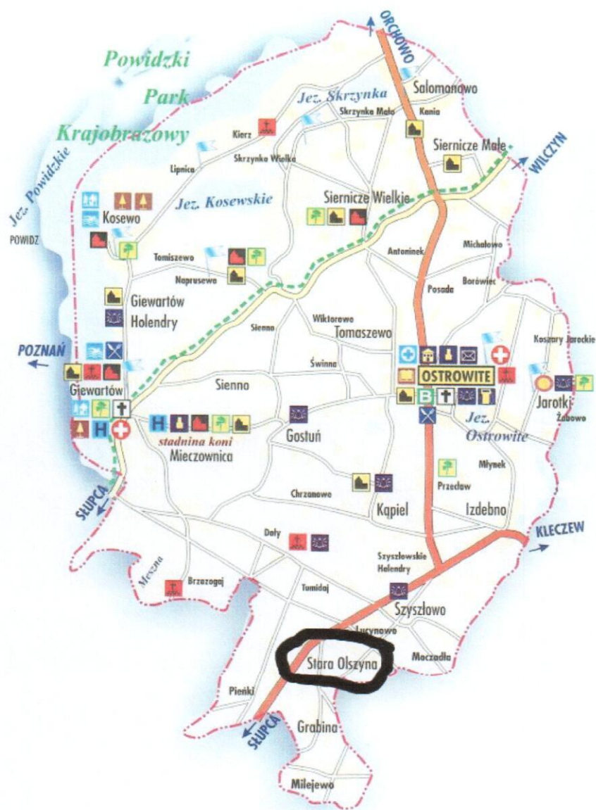
Rys. 1. Mapa Gminy Ostrowite

Wieś Stara Olszyna przynależy administracyjnie do gminy wiejskiej - Ostrowite, jednej z ośmiu gmin powiatu słupeckiego. Położona jest w jej zachodniej części.